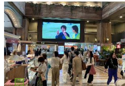
天王寺セントラルビジョン