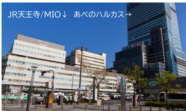
JR天王寺駅中央改札より御堂筋線天王寺駅へ